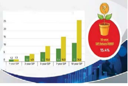
कोटक इन्व्हेस्टमेंट फंड पान २