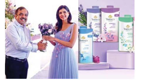
याईले लंडनने केले कल्याणी प्रियदर्शनला नवीन ब्रँड अम्बेसडर पान ३