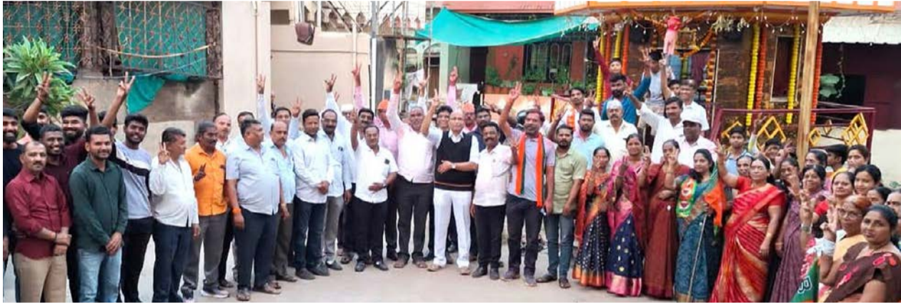
लासलगाव : येथे महायुतीच्या विजयाचा जल्लोष साजरा करताना लासलगाव मंडल भाजपचे पदाधिकारी व कार्यकर्ते.