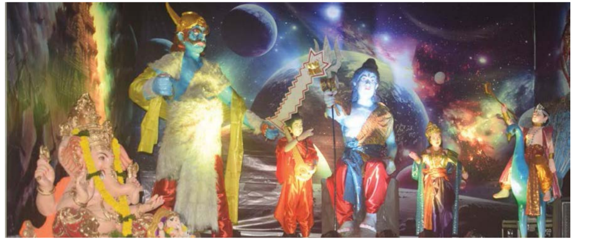
▶ इंद्रकुंड मित्रमंडळ, तारकापुराचा वध असलेला देखावा