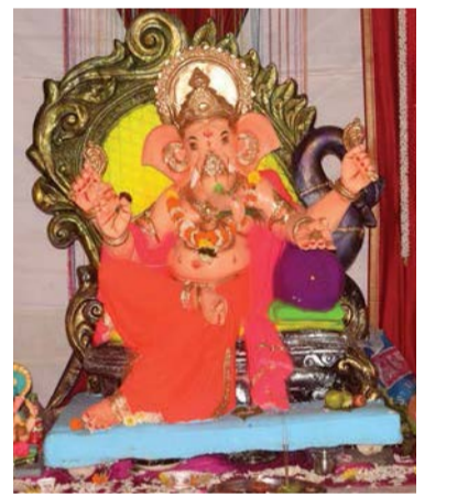
▶ वेतालेश्वर मित्रमंडळ, चार हत्ती पुल, जुना आडगाव नाका