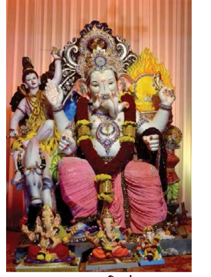
▶ अचानक मित्रमंडळ, गजानन चौक, पंचवटी