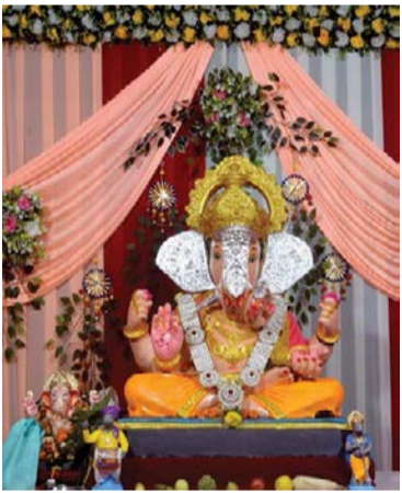
▶ बजरंग मित्रमंडळ, नाग चौक, पंचवटी