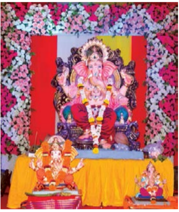
▶ कृष्णनगर युवक मित्रमंडळ