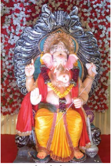
▶ आदिवासी जीवरक्षक दल, रामकुंड मित्रमंडळ