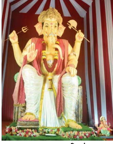
▶ भडक दरवाजा मित्रमंडळ, दिंडोरी नाका