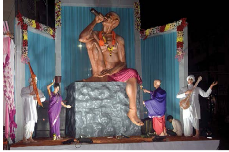
▶ श्रीकृष्णनगर मित्रमंडळ, जुना आडगाव नाका