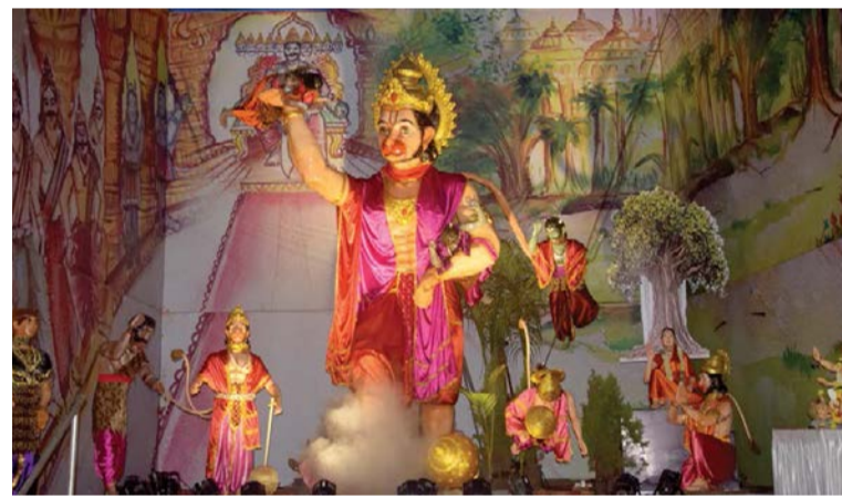
▶ मालेगाव स्टॅड मित्रमंडळ, लंका दहनाचा देखावा