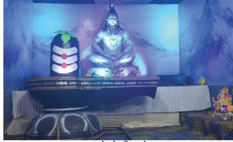
▶ ओम प्रेम फ्रेंड सर्कल