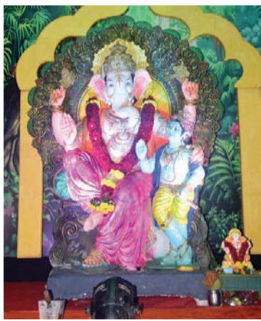
▶ श्री मुंजोबा मित्रमंडळ, गणेशवाडी