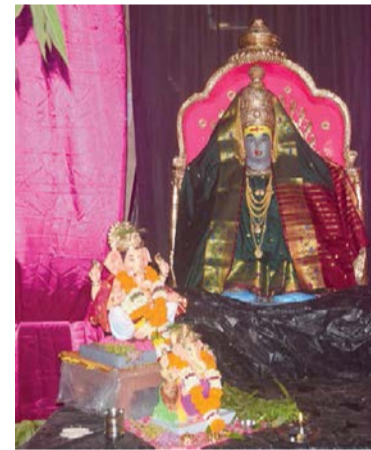
▶ चार्ली ग्रुप, पाथर्वट लेन, पंचवटी