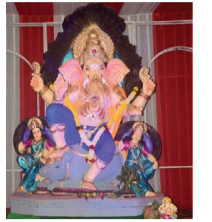
▶ कालिका माता मित्रमंडळ, गणेशवाडी, पंचवटी