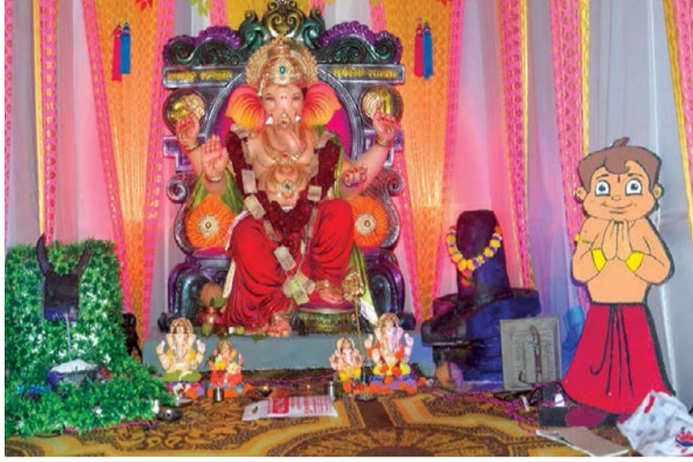
▶ ओम शिव फ्रेंड सर्कल, गुरुद्वारा मार्ग, पंचवटी